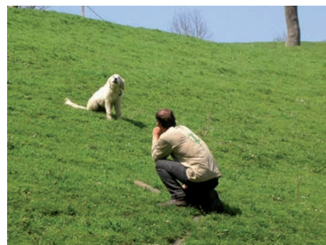
Visite de suivi

❷ La coordination de l'action L'équipe des animateurs Chiens de Protection est répartie sur l'ensemble du massif pyrénéen, ce qui permet d'avoir une vision d'ensemble sur la population de chiens placés au troupeau.