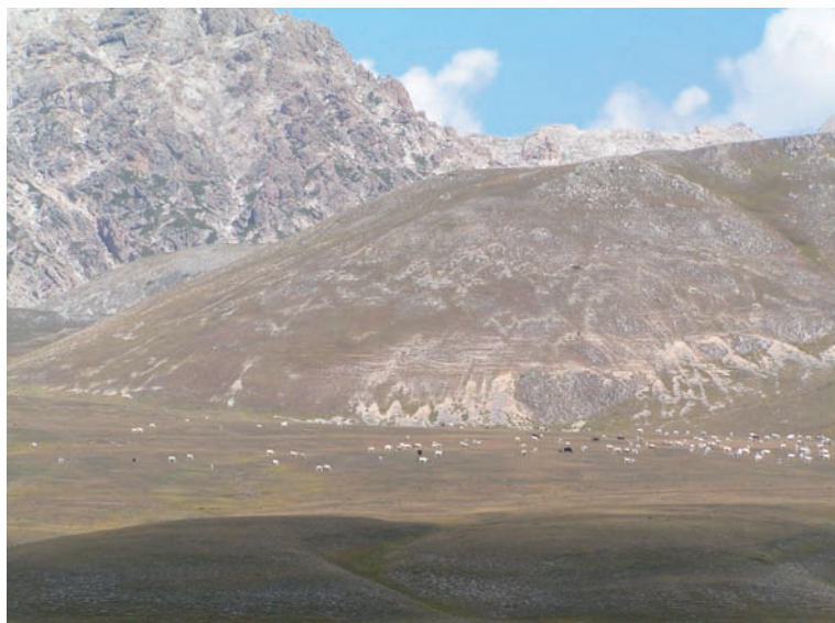
Gran Sasso – Abruzzes

Novembre 2007. Une délégation d'éleveurs, de bergers et d'animateurs chiens de Protection des Pyrénées part à la découverte d'homologues italiens dans le Parc National des Abruzzes. Deux jours de rencontre et une idée : retourner en Italie en élargissant les échanges à un plus grand nombre d'éleveurs. Un souhait devenu réalité du 24 au 31 août dernier. S'appuyant sur le programme Life Coex, une nouvelle délégation de six personnes – dont cinq éleveurs pyrénéens – a donc mis le cap sur les régions des Abruzzes et de l'Ombrie : direction les Parcs Nationaux du Gran Sasso, de la Majella et la province de Perugia. Dans le prolongement de notre Lettre de juin 2008, retour sur cette vie pastorale à l'italienne, avec de nouveaux témoignages et des constats édifiants.