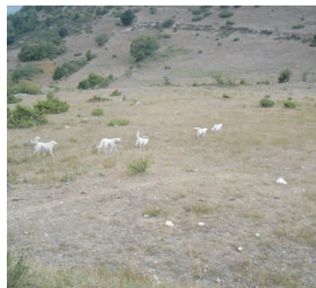
Meute de chiens en divagation

Néanmoins pour être tout à fait exact, nous avons pu observer un certain nombre de gros chiens blancs en état de divagation : en tous les cas non attachés aux brebis.