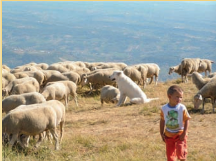
Fils de berger

On s'aperçoit que les éleveurs ont, culturellement, une maîtrise évidente de leurs chiens. Par exemple : ils sont tous capables d'attraper leurs chiens quand ils le souhaitent. Ceci est le résultat d'une présence humaine importante sur les troupeaux. A ce propos, un éleveur de Campo Imperatore nous indique « qu'une manipulation des chiots à partir de la 5ème semaine (40ème jour) est une chose importante. » Son propos vient confirmer le notre, tout en gardant pour priorité l'attachement au troupeau. Cette socialisation à l'humain est sans doute un élément de compréhension de ce que nous avons observé. En effet, dans la grande majorité des cas, nous avons constaté que les troupeaux étaient équipés de nombreux chiens que nous pouvons qualifier de stables (ni peureux, ne faisant jamais preuve d'une agressivité non justifiée). Ceci est particulièrement intéressant.