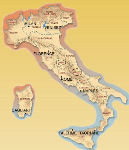
Régions visitées : Ombrie et Abruzzes

Le Parc couvre environ 150 000 hectares. C'est la plus grande zone protégée d'Italie et la plus haute des Apennins. Il y est dénombré 70 000 ovins (contre 1 million trente ans auparavant), 10 000