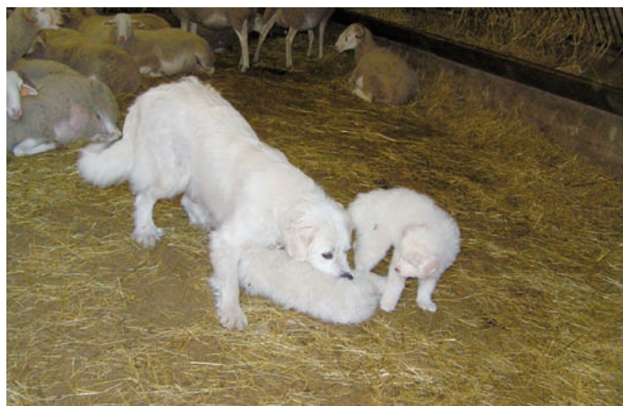
Apprentissage des signaux

Il est nécessaire que le chiot puisse rester jusqu'à 7-8 semaines avec sa mère et l'ensemble de la fratrie, pour plusieurs raisons. D'une part, il est important que l'alimentation soit au lait de la mère pour un meilleur développement. Ainsi, l'âge de la séparation est conditionné par le sevrage qui ne peut intervenir que vers 7 semaines. L'éleveur peut assurer la transition de l'alimentation lactée vers une alimentation solide (croquettes) entre 4 et 7 semaines. D'autre part, il est absolument nécessaire que les premières semaines de la vie du chiot se déroulent parmi les congénères de manière à ce qu'il intègre un certain nombre de signaux de communication qui régissent son espèce (garder un seul chiot dans une portée est donc à proscrire).