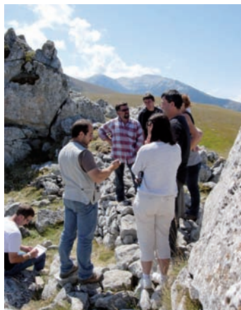
Une partie de la délégation

Le rôle de La Pastorale Pyrénéenne est aussi d'être une force de proposition. Là est le sens de notre présence au sein du Groupe National Ours dans les Pyrénées installé par la Secrétaire d'Etat chargée de l'Ecologie.