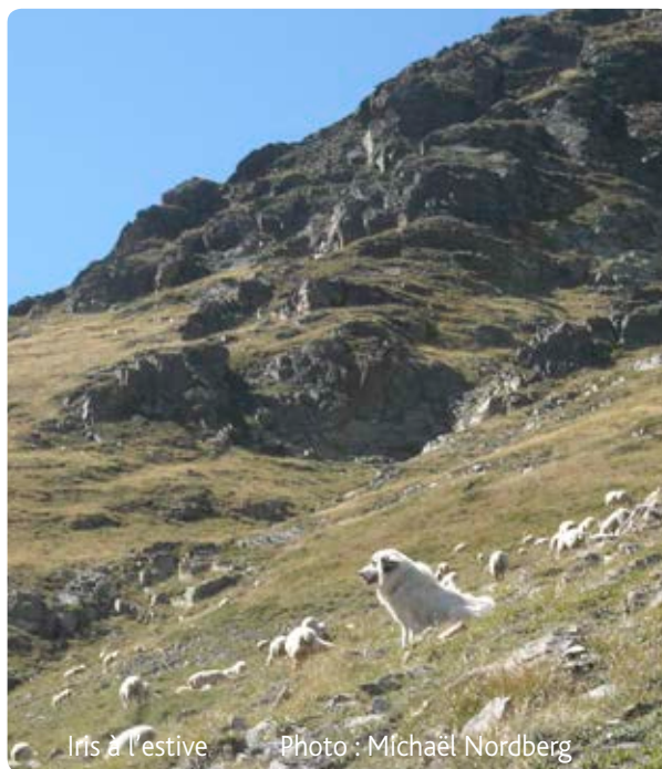
Iris à l'estive

On valide cette première phase et on monte à la montagne avec la Patou. Cela demande beaucoup d'attention, d'observation et quelques interventions pour s'assurer que tout se passe bien avec les brebis, les autres chiens, les randonneurs. Tout cela en début de saison alors qu'il y a d'autres chats à fouetter en même temps : des portages à cheval qui sont aussi une petite nouveauté cette année, des problèmes d'eau et d'électricité à la cabane, une nouvelle stagiaire qui arrive et un jeune chien de conduite en apprentissage... et moi qui suis encore tout jeune dans le métier ! Les bergers d'appui de La Pastorale encore présents au début de l'estive et la stagiaire qui, heureusement n'est pas une inconnue, permettront de passer ce cap difficile. Et surtout, Iris se révèle être une super Patou. Les quelques blagues qu'elles nous font au début de la saison (bloquer une ou 2 fois le troupeau sur un chemin ou nous le retourner alors que les brebis sont calmement en train de manger ou de prendre la virée...) sont vite compensées par la cohésion qu'elle apporte au troupeau à d'autres moments, sa présence réconfortante la nuit (une fois qu'on apprend à ne pas se lever à chaque aboiement et au contraire à distinguer son niveau d'activité...) et tout simplement sa sympathie parce que oui, cette chienne-là, elle est attachante !