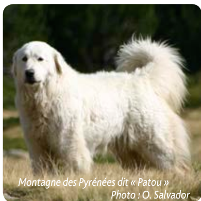
Montagne des Pyrénées dit « Patou »

Une des idées régulièrement véhiculée ces derniers temps est que la nouvelle arme en matière de chiens de protection, c'est le Maremme Abruzzes. Parallèlement, le Montagne des Pyrénées, le Patou, serait relégué à un simple objet patrimonial sans efficacité. L'intellectualisation du sujet par des personnes qui ne sont pas des experts en cynophilie conduit à de telles aberrations. Nous souhaitons réagir à de tels propos. Si, en matière de chiens de conduite, certaines races se distinguent des autres par des qualités supérieures, on ne peut pas établir de distinctions aussi flagrantes parmi les races de protection.