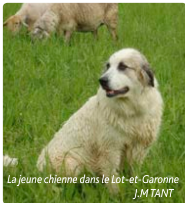
La jeune chienne dans le Lot-et-Garonne J.M TANT

Le printemps est arrivé les beaux jours avec, nous décidons avec la technicienne que le jour de lâcher la chienne dans le pré était arrivé. J'avais en tête ces images du DVD présentant ce moment délicat où le