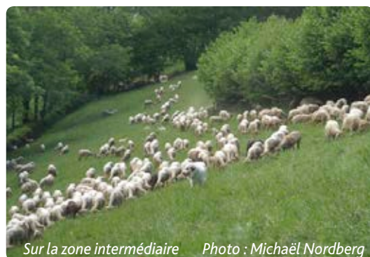
Sur la zone intermédiaire

Je suis impatient de revoir Iris surveiller l'évolution du troupeau du haut d'un rocher.