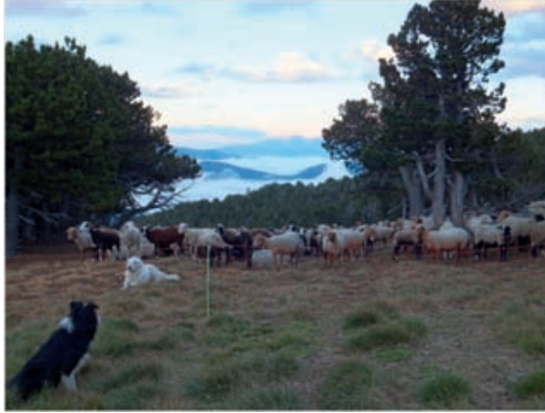
Parc de nuit à Formiguères

Aide au montage et démontage de parc de nuit électrifié. L'objectif de cette action est de « tester » la mise en parc du troupeau, le choix du lieu, le matériel en vue de mettre en place un parc permanent. La mise en place des parcs par le RBA peut être réalisée suite à une prédation mais l'objectif est plutôt la prévention.