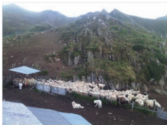
La traite à l'estive de Narbèze