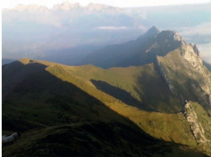
estive de Narbèze, quartier Nord Ouest