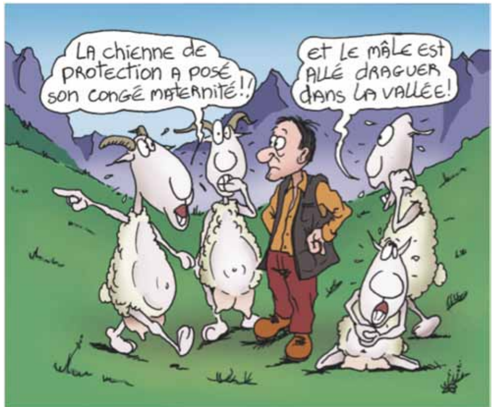
Dessin : Alain Chrétien

A la phase de chaleurs succède une période au cours de laquelle la chienne est sous l'effet de la progestérone, qui est l'hormone de la gestation sécrétée par les corps jaunes issus des ovulations survenues pendant les cha-